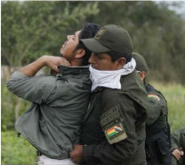
«En esta salvaje intrusión se evidenciaron múltiples excesos de brutalidad, crueldad, violencia...».