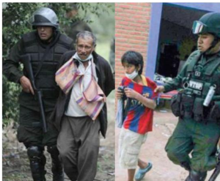
La represión en Takovo Mora descubrió una faceta del Estado Plurinacional que muchos ignoraban: la de ser reproductor de la permanente represión a los indígenas en Bolivia, en la que las «autonomías indígenas» y «consultas previas» eran solo discurso para incautos. Esta vez, esa represión no perdonó ni a personas de la tercera edad ni a niños.