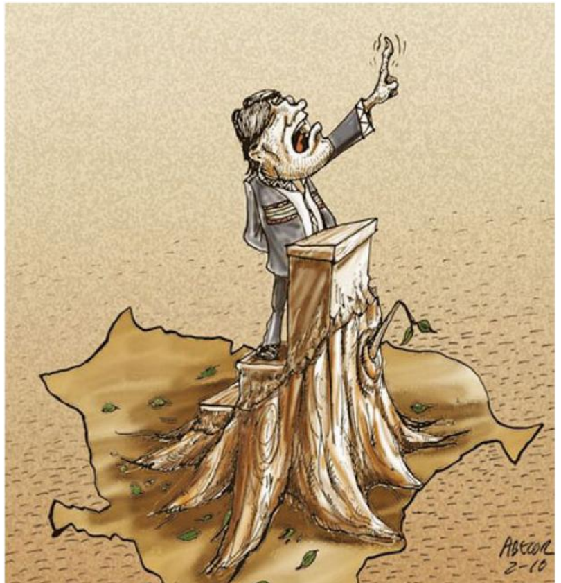
La actual decisión presidencial de levantar la intangibilidad del TIPNIS demuestra que sus anteriores declaraciones ambientalistas de defensa de la pachamama fueron solo poses líricas y demagógicas, quedando para la historia como un gobierno más de naturaleza explotadora de la naturaleza.

2. Empero, la segunda realidad –contradictoria con la anterior– es que un grupo importante de agricultores dedicados a la producción