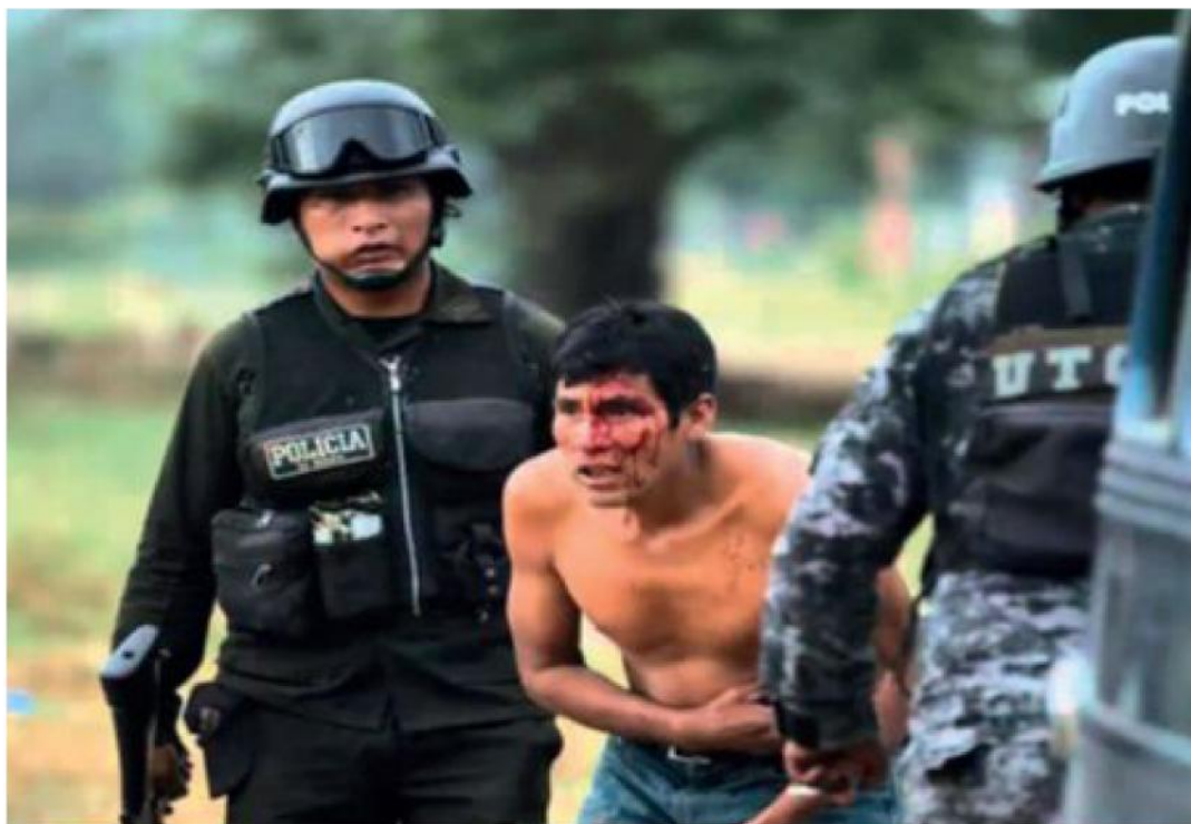
«Pero, no se respetó a nadie, directamente entraron a gasificar, a patear, a torturar a nuestros hermanos y hermanas».

Inicialmente las comunidades guaraníes instalaron un punto de bloqueo en el ingreso de la planta separadora de líquidos en Río Grande (Santa Cruz). Según el presidente del Consejo Continental de la Nación Guaraní (Conagua), Celso Padilla, la determinación fue adoptada en el mes de julio en una reunión nacional de la Asamblea del Pueblo Guaraní (APG). Como primera medida de presión,