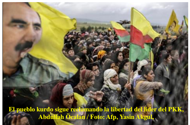
El pueblo kurdo sigue reclamando la libertad del líder del PKK, Abdullah Öcalan

Para encarar estos y otros problemas, es que se debe declarar la emergencia, que reclaman con justicia los agricultores y no la emergencia como el mecanismo de burlar los controles de los gastos del recurso publico como acostumbraban los corruptos, que abundan en el Perú más que las papas.