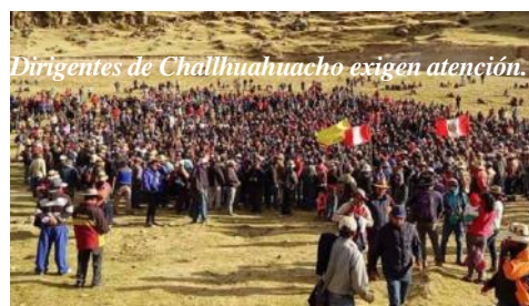
Dirigentes de Challhuahuacho exigen atención.