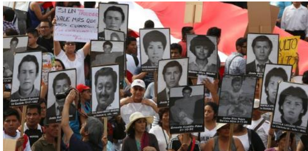
Desde la noche en que PPK dio el indulto al asesino y ladrón Alberto Fujimori, comenzaron las manifestaciones de rechazo en diversos lugares del país. Estas continúan realizándose.

A esto se suman muchas declaraciones y también movilizaciones en el exterior. Algo de eso mostramos acá.